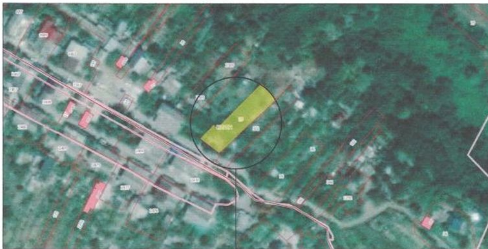
Место расположения объекта